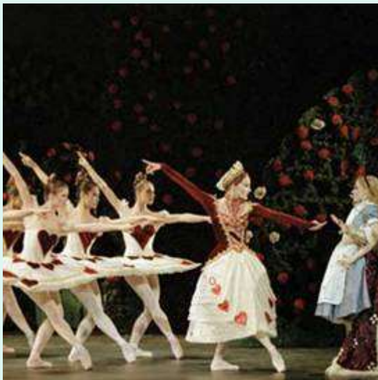
Алиса в Стране Чудес

Много замечательных опер и балетов поставлено по сказкам.